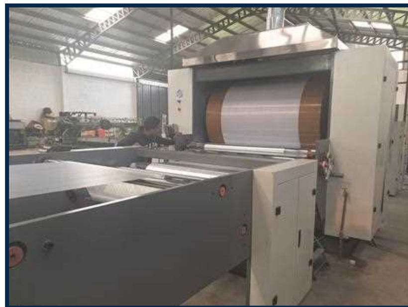
Fabricamos nuestra propia fibra balística