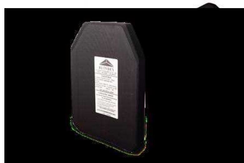
Placa flexible frontal y posterior