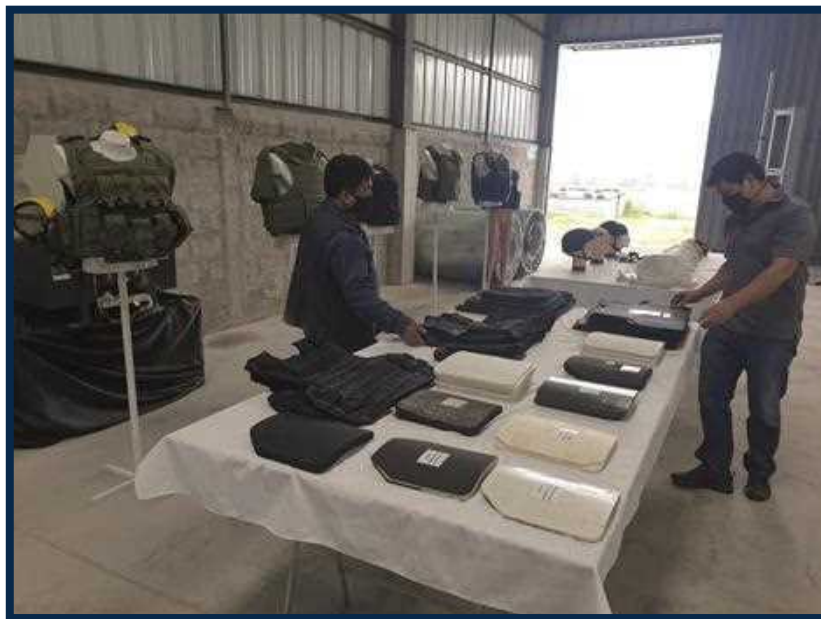
Showroom de productos y accesorios